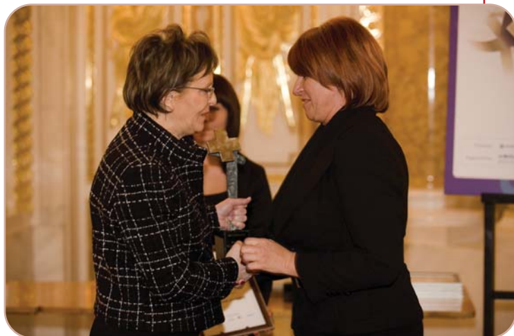
Fundacja Urszuli Jaworskiej zwyciężyła w kategorii działalność charytatywna – na zdjęciu patronka z minister Ewą Kopacz