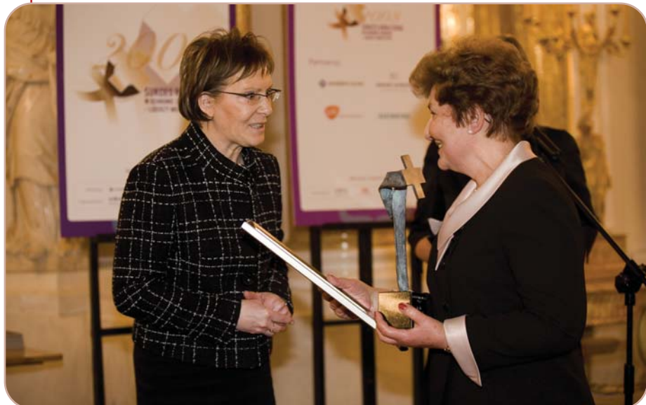
Maria Ilnicka-Mądry – Menedżer Roku 2008 w Ochronie Zdrowia – SPZOZ przyjmuje gratulacje od minister Ewy Kopacz