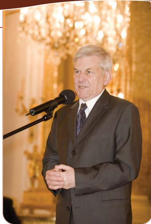
Profesor Andrzej Szczeklik dziękuje Kapitułę za przyznanie mu tytułu Człowiek Roku 2008 w Ochronie Zdrowia