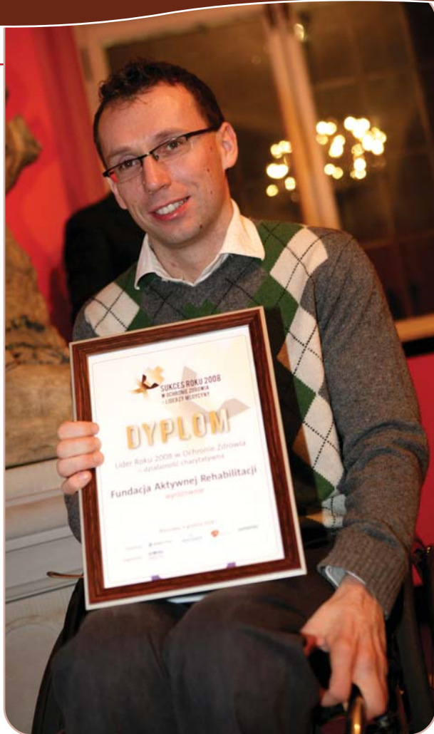
Przedstawiciel Fundacji Aktywnej Rehabilitacji, wyróżniony w kategorii Lider Roku w Ochronie Zdrowia – działalność charytatywna