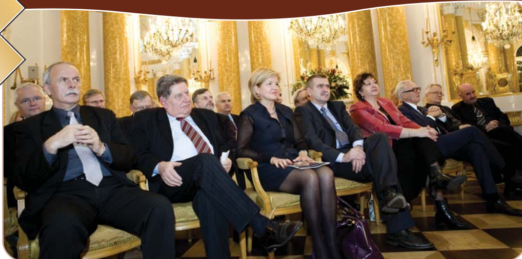
Członkowie Kapituły Konkursu Sukces Roku w Ochronie Zdrowia