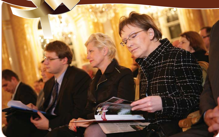
Ewa Kopacz, minister zdrowia, przed rozpoczęciem uroczystości. Obok wiceprzewodnicząca Sejmowej Komisji Zdrowia, posłanka Beata Matecka-Libera