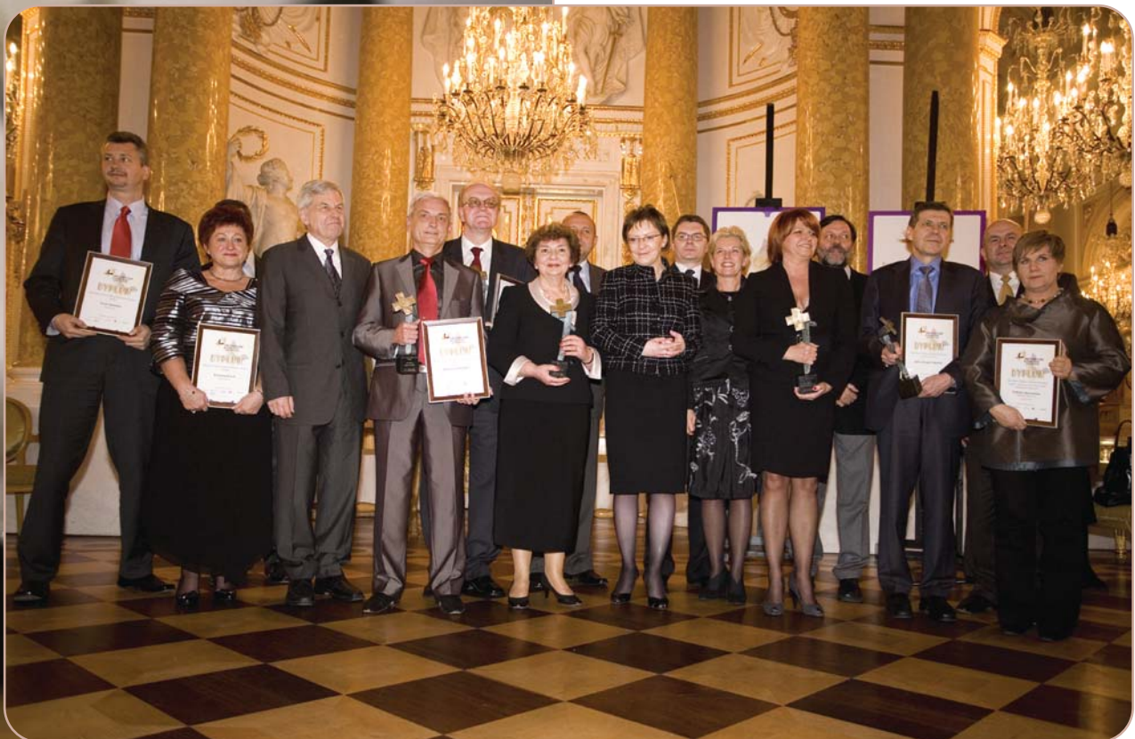
Tegoroczni laureaci i wyróżnieni w Konkursie

Tradycyjnie już Gala na Zamku Królewskim, wieńcząca konkurs Sukces Roku w Ochronie Zdrowia , zgromadziła wybitne osobistości polskiego sektora ochrony zdrowia. Statuetki najlepszym – dziękując im za wspaniałą pracę i osiągnięcia – wręczała minister zdrowia Ewa Kopacz.