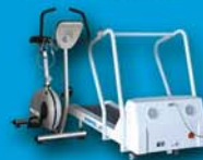
Rehabilitacja kardiologiczna AsTER