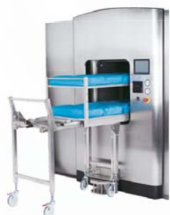
● sterylizator parowy Evolution

Oferujemy: kompleksowe wyposażenie Bloków Operacyjnych i Centralnych Sterylizatori • serwis • pomoc w pozyskiwaniu finansowania.