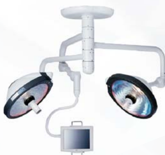
● lampy operacyjne Harmony™