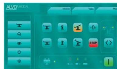
Zintegrowany system sterowania salą operacyjną INTEGRA