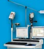
Badania EEG AsTEK