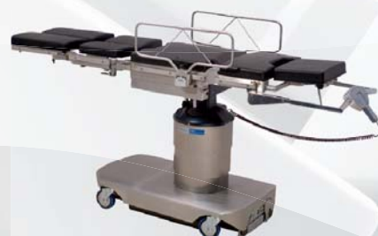
● stół operacyjny CMAX™