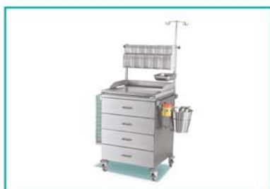
Meble i wyposażenie