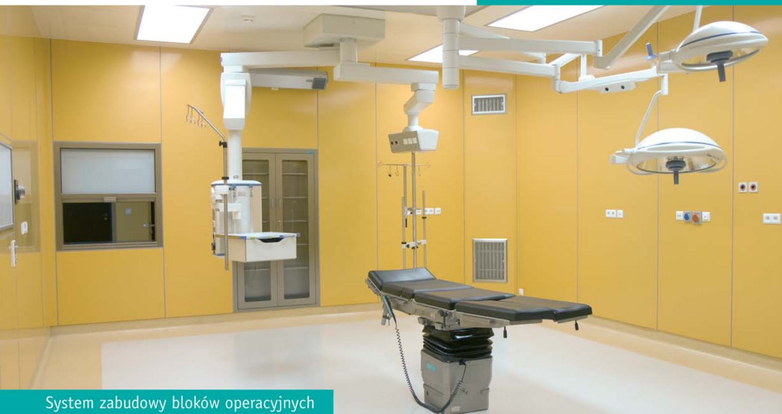
System zabudowy bloków operacyjnych