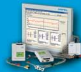
Holter EKG HolCARD 24W