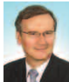
lek. Grzegorz Wrona przewodniczący Okręgowego Sądu Lekarskiego organizacja ochrony zdrowia, anestezjologia