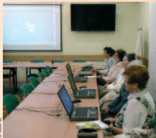
for. Marek Saj

W lipcu zakończyła się również wymiana poszycia dachowego budynku przy ul. Nowowiejskiego 51 oraz montaż klimatyzacji w Kancelarii Okręgowego Sądu Lekarskiego. W sierpniu natomiast przeprowadzono postępowanie konkursowe na modernizację parkingu w siedzibie WIL w Poznaniu – prace tuż, tuż. Niestety spowodują one wyłączenie z użytkowania parkingu, ale warto przeoczekać to utrudnienie, choć oczywiście z góry za nie przepraszamy.